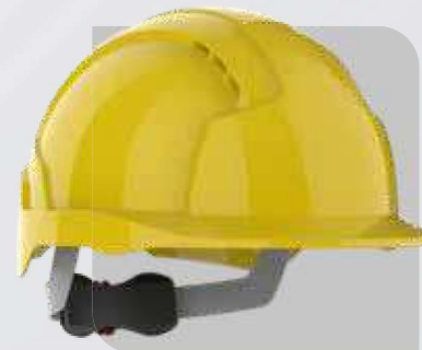
Hełm ochronny EVOLite®