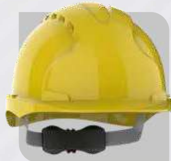
Hełm ochronny EVO®3