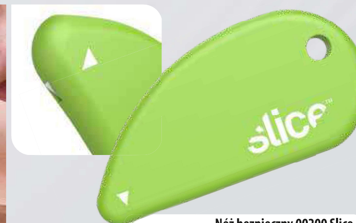
Nóż bezpieczny 00200 Slice