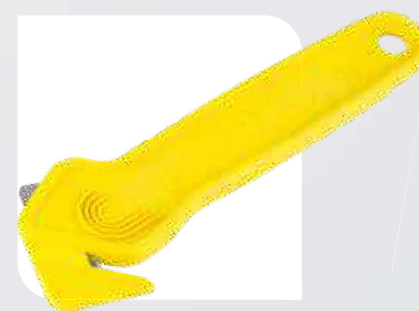
Nóż bezpieczny z ukrytym ostrzem EBC1