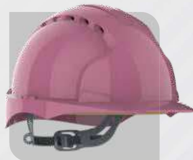
Hełm ochronny EVO®2