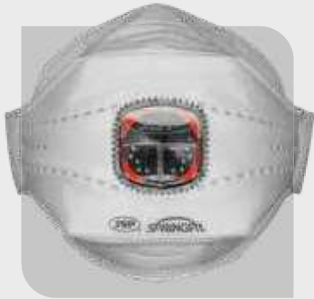
Masczka SpringFit™ FFP3 435ML, zawór Typhoon