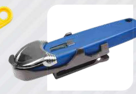
Nóż bezpieczny 3w1 S7