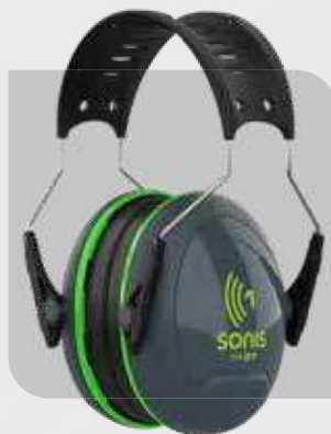
Ochronniki słuchu Sonis1 SNR 27