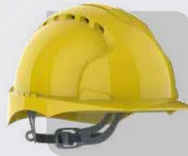
Hełm ochronny EVO®2