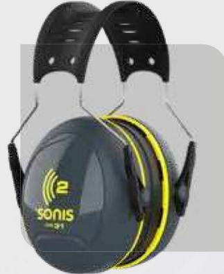
Ochronniki słuchu Sonis2 SNR 31