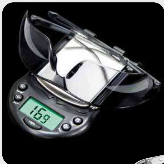
Okulary ochronne Stealth™ 16g