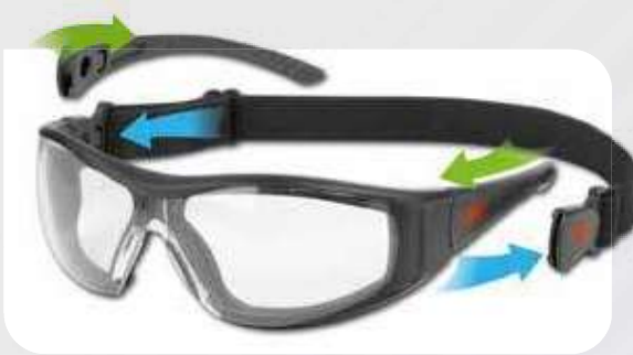
Stealth™ Hybrid zestaw okulary/gogle