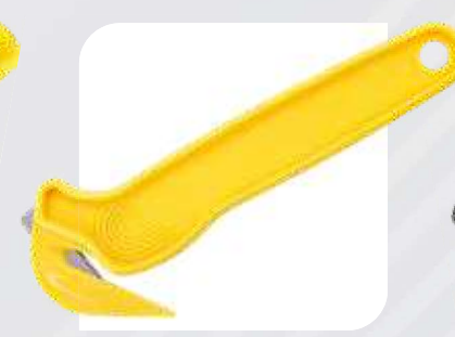
Nóż bezpieczny z ukrytym ostrzem DFC-364