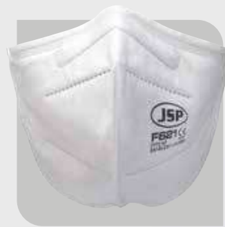
Masczka przeciwpyłowa FFP2 (F621)