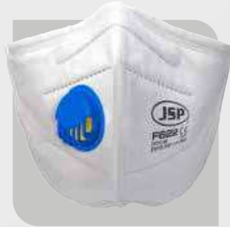
Masczka przeciwpyłowa FFP2V (F622)