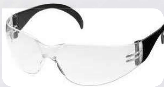
Okulary ochronne M9400